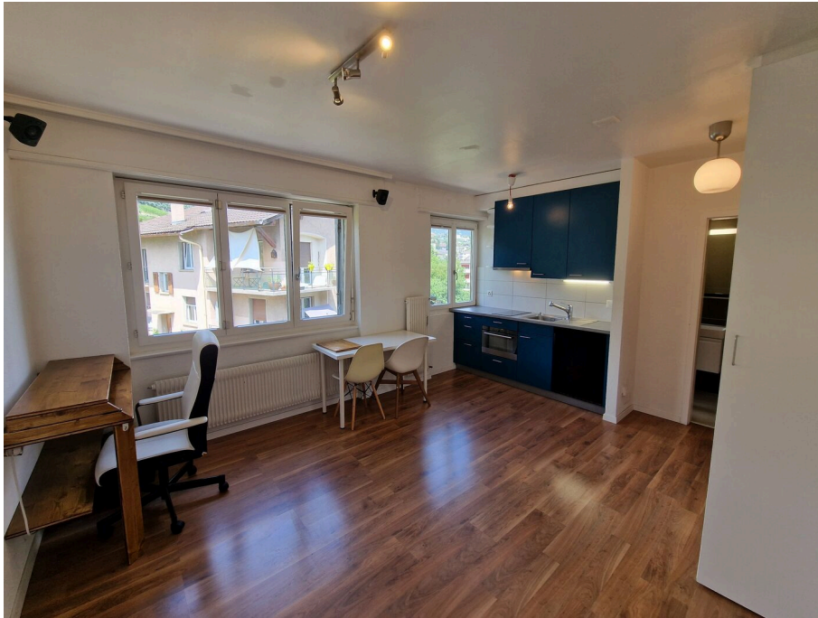
Séjour / chambre