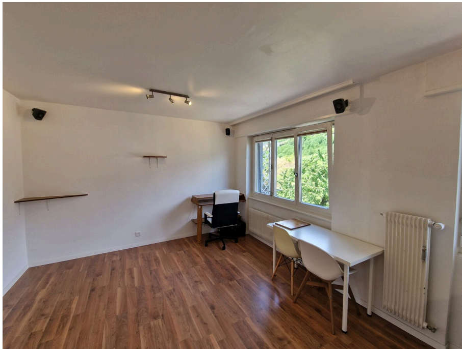
Séjour / chambre