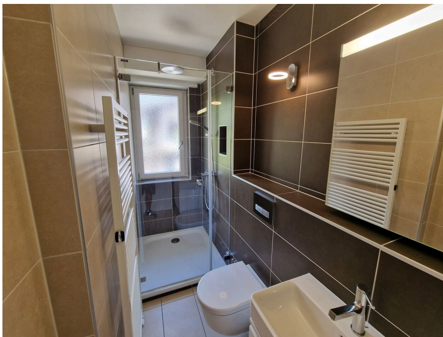
Salle d'eau avec douche