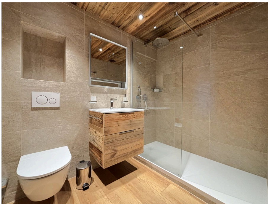
Salle d'eau avec douche à l'italienne