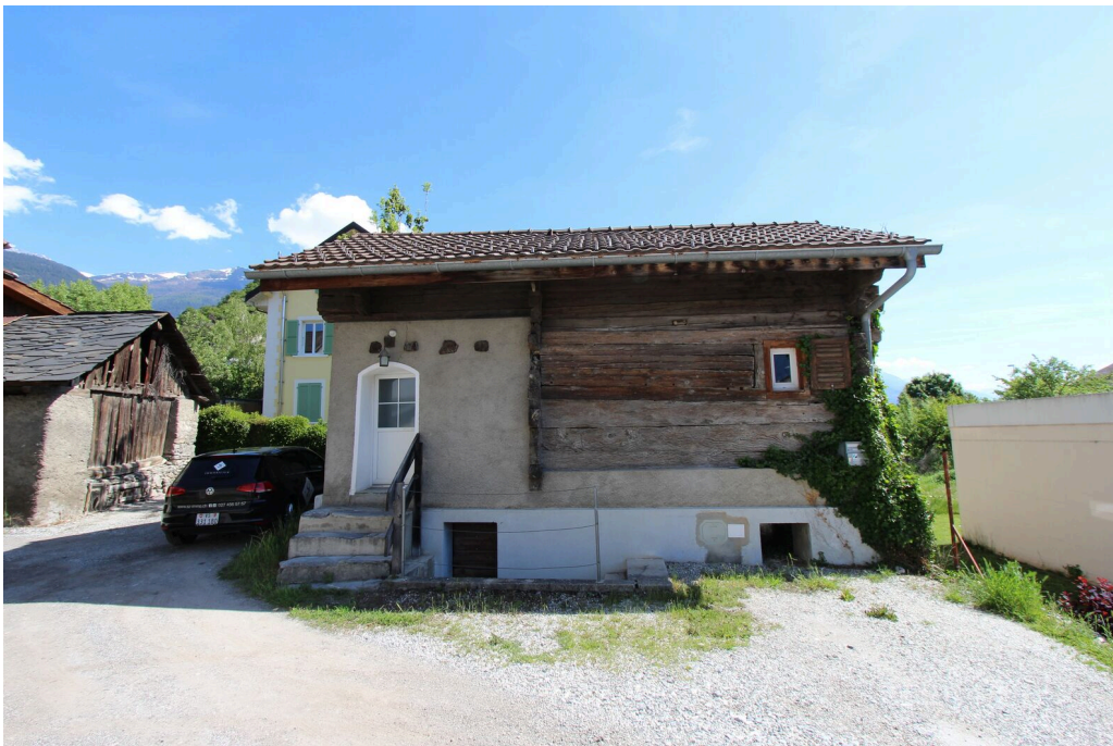
Point de vu extérieure de la maison