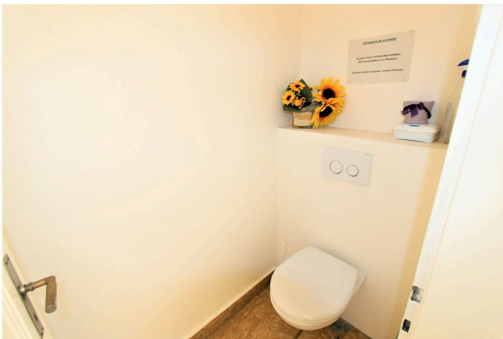
WC et lavabo en commun