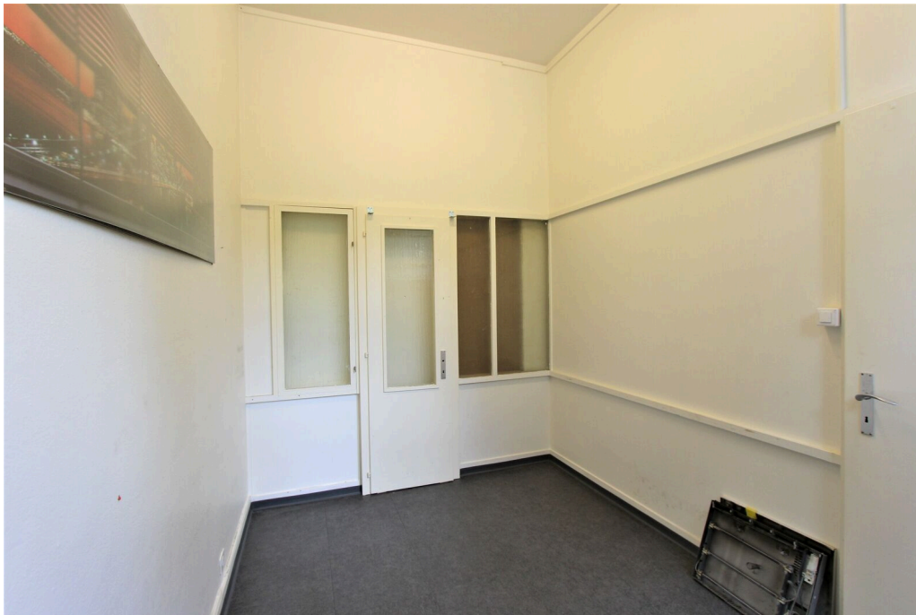
Espace de stockage