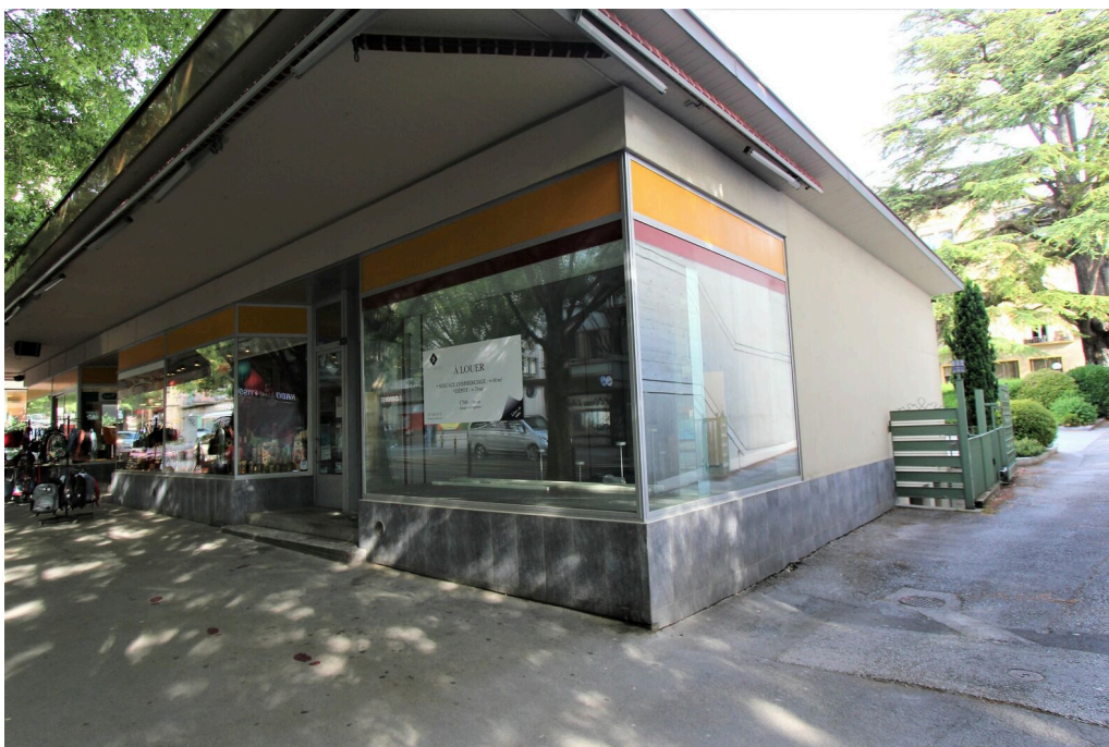
Vitrine vue depuis la rue commerçante