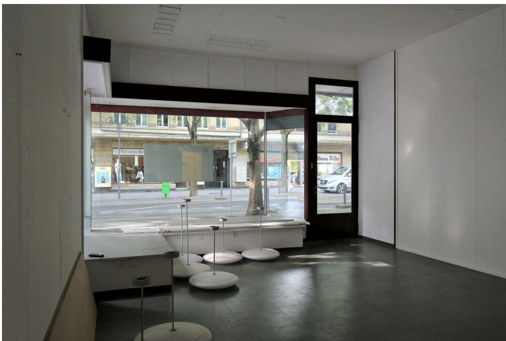
Surface commerciale à plein pied