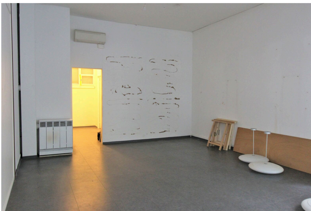
Surface commerciale à plein pied