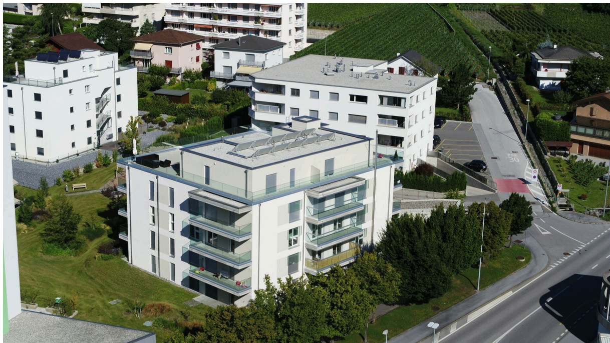
Vue extérieure de l'immeuble