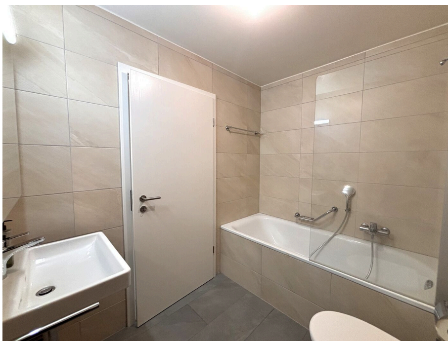
Salle de bain avec raccordement pour colonne de lavage