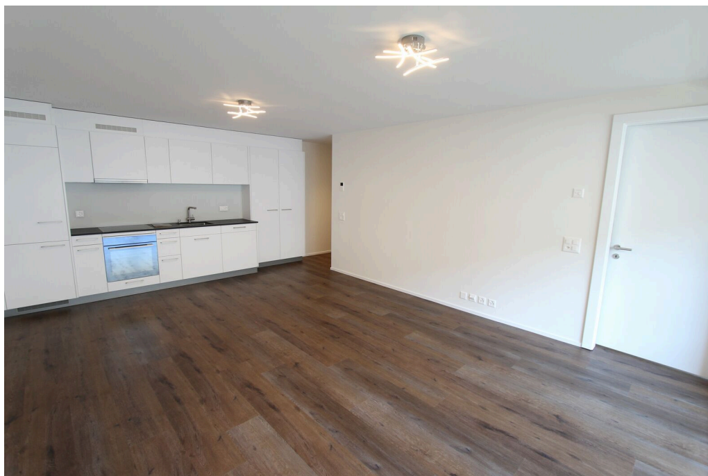
Séjour d'environ 26 m2