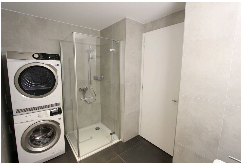
Salle d'eau avec colonne de lavage