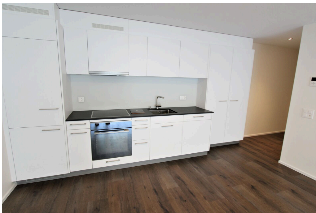
Cuisine ouverte sur le séjour