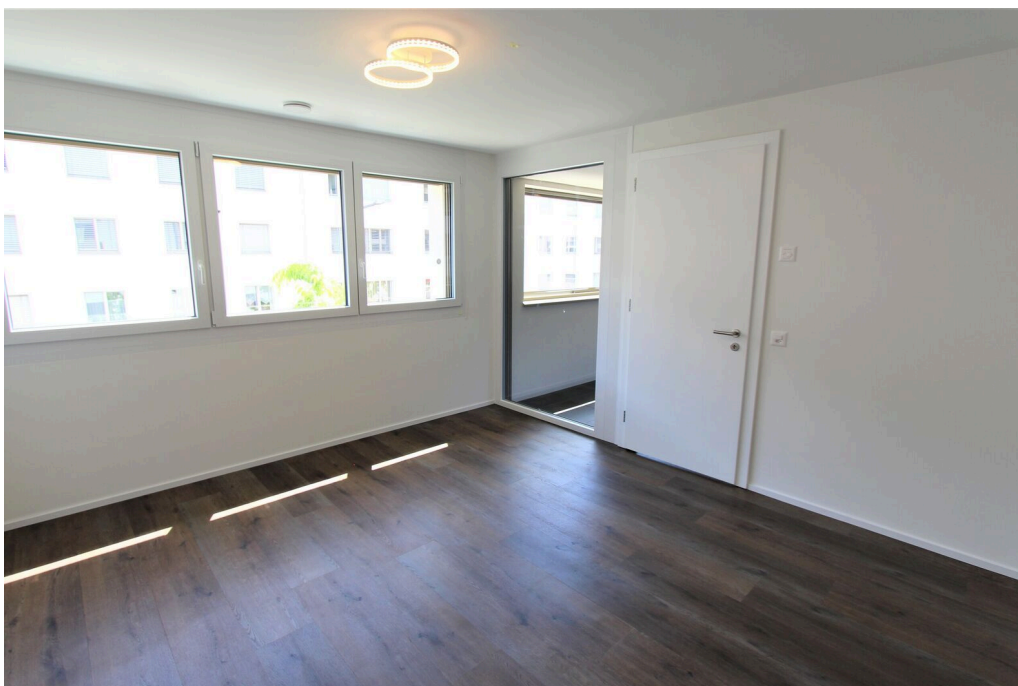
Chambre d'environ 14 m2