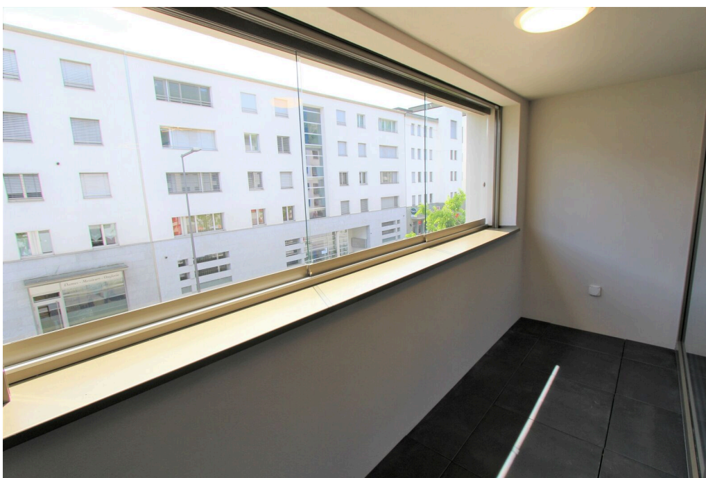
Loggia d'environ 5 m2