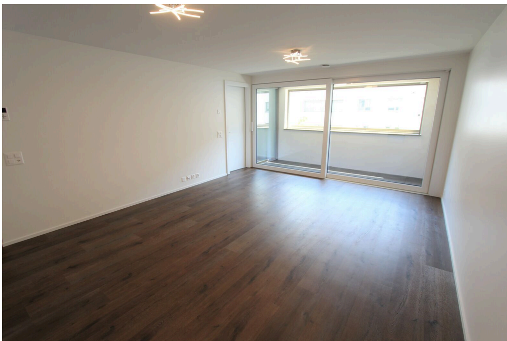
Séjour avec accès à la loggia