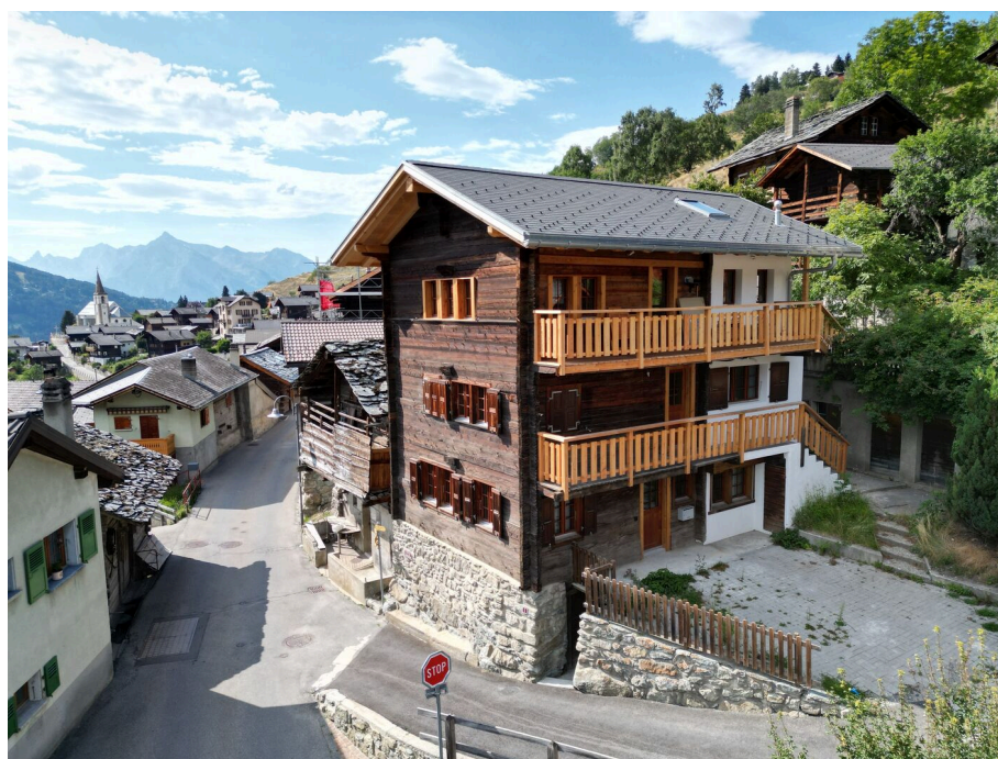
Vue extérieure de l'immeuble