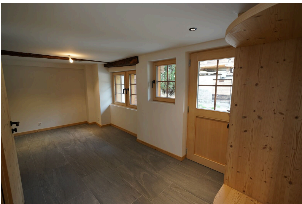
Entrée et séjour